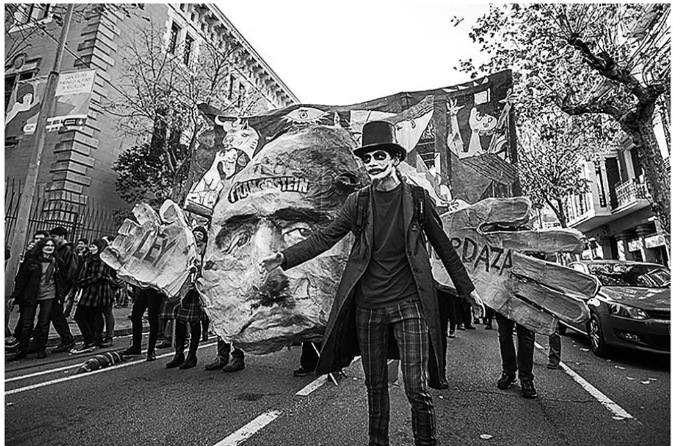
Manifestació del 20 de Desembre del 2014 a Barcelona: Contra la Llei Mordassa: ens Plantem.