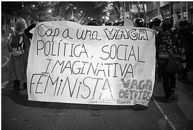
Manifestació del 22 d'Octubre del 2014 a Barcelona

Des d'Endavant OSAN creiem que la lluita per la construcció del socialisme feminista als Països Catalans és l'únic camí.