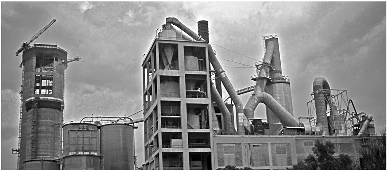
Finca cimentera de Sant Vicenç dels Horts, propietat de Ciments Molins.